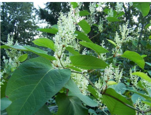
Renouée du Japon

noir. Elle a été introduite au XIX e siècle pour ses qualités mellifères et depuis n'a cessé de progresser et de coloniser de nouveaux territoires. C'est une plante extrêmement difficile à éradiquer, ses racines descendent à plusieurs mètres de profondeur. La partie aérienne gèle facilement mais la racine ne meurt jamais.