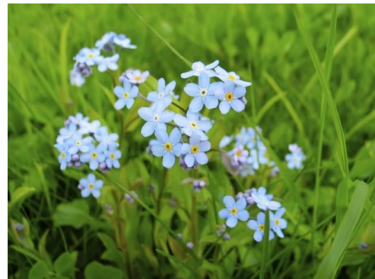
Myosotis des marais

Le myosotis des bois », « ne m'oublie pas », plante bisannuelle de 10 à 50 cm, Il en existe plusieurs variétés horticoles.