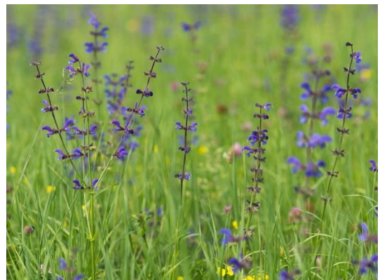
Sauge des prés

La sauge glutineuse « sauge visqueuse », plante mellifère