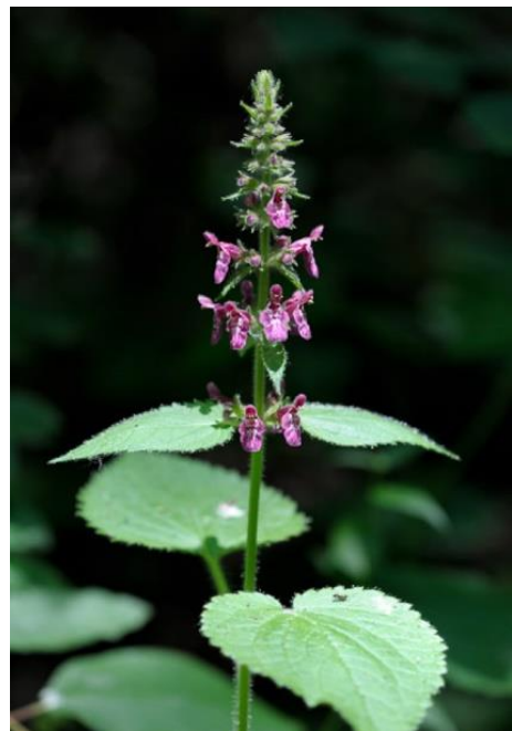
Épiaire des Alpes

« crapaudine », plante de 30 à 90 cm, assez rare jusqu'à 2 200 m. elle peut donner une