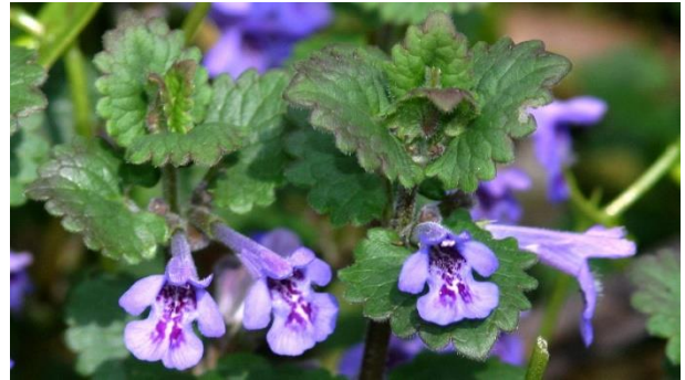
Figure 1 Gléchome faux-lierre

La nepeta à feuilles lancéolées semblable à la précédente, de 30 à 50 cm.