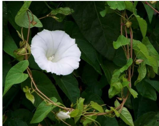
Liseron des haies