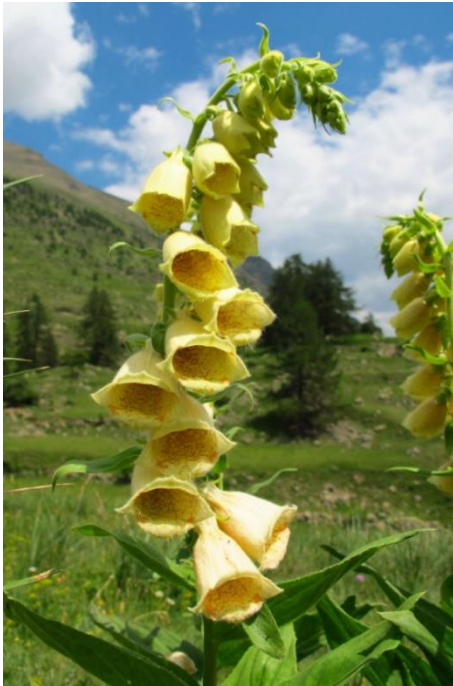
Digitale à grandes fleurs

La scrofulaire des chiens plante de 10 à 50 cm, tige dressée ramifiée, fleurs pourpre noirâtre mêlé de blanc, la plante est plus ou moins vénéneuse.