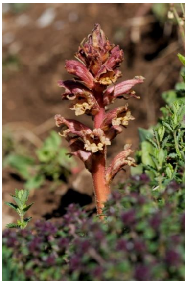
Orobanche du thym

Le pédiculaire feuillé « fougère sauvage », plante vivace de 15 à 70 cm.