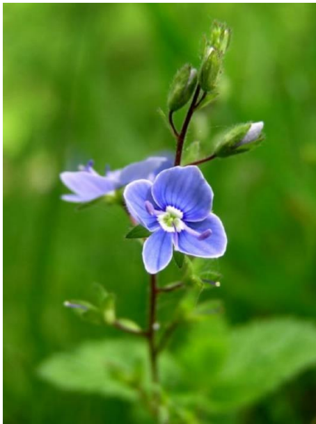
Véronique petit chêne

La linnaire des murailles « cymbalaire », plante importée d'Italie au XV ème siècle. Assez commune dans les murs humides.