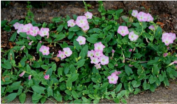
Liseron des champs

La plante donne des fruits : organe végétal contenant une ou plusieurs graines.