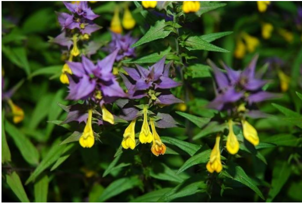
Mélampyre des bois

colorant jaune pour la laine et jaune citron pour la soie. C'est une mauvaise herbe que les bestiaux n'aiment pas et elle parasite les plantes fourragères voisines.