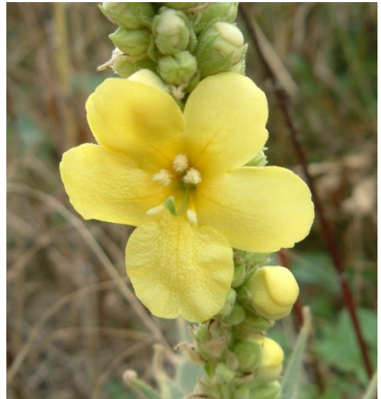
Bouillon blanc (fleurs)

La molène noire « bouillon noir », plante de 50 à 100 cm, inflorescence terminale allongée de fleurs jaunes à taches rouges.