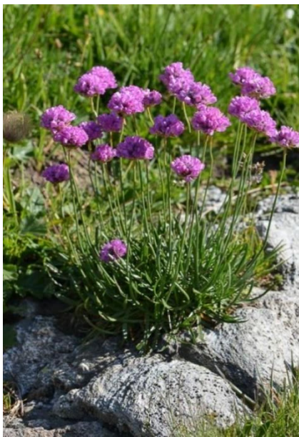
Armérie des Alpes

Le plantain lancéolé « herbe à 5 côtes, herbe à 5 coutures », plante de 10 à 40 cm, très commun. C'est un bon fourrage.