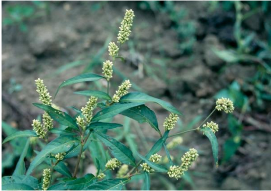
Renouée à feuilles de patience

La renouée amphibie « renouée aquatique », plante vivace à souche rampante submergée. Marais, vasières.