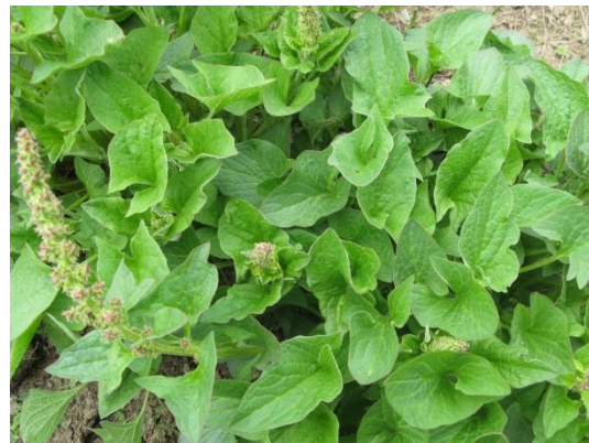
Chénopode bon Henri

Le chénopode des murs « patte d'oie des murs », plante de 20 à 70 cm.