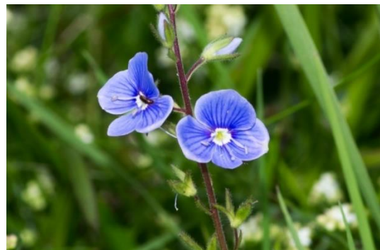
Véronique des champs

La véronique des Alpes petite plante de 5 à 15 cm. Pelouses de montagnes, entre 1 600 et 2 500 m.