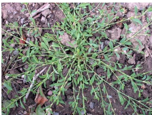
Renouée des oiseaux

La renouée bistorte « serpentaire, langue de bœuf », plante de 30 à 120 cm, épi cylindrique, dense, de fleurs rose-rouge, les feuilles sont alimentaires et les graines nourrissent les oiseaux.