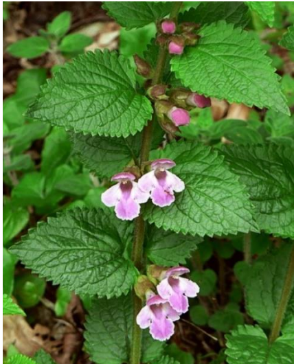
Mélitte à feuilles de mélisse

La nepeta chataire « herbe aux chats », plante de 40 à 80 cm, Les chats sont attirés par l'odeur de la plante.