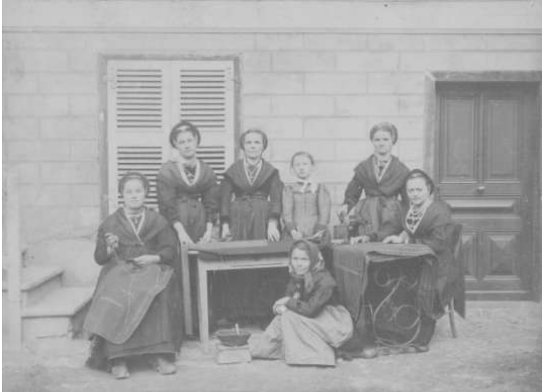
Archives privées, femmes de la famille Allamand, vers 1900