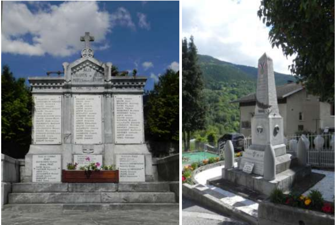
Monuments aux morts de Séez et Bellentre (Caroline Favre, 2014)

Firmin est tué le 24 août 1916, lors d'un assaut à Maurepas, dans la Somme. Son nom figure avec ceux des autres Séerains et Bellentrais morts pour la France, sur les monuments de sa commune de naissance et de sa commune d'adoption.