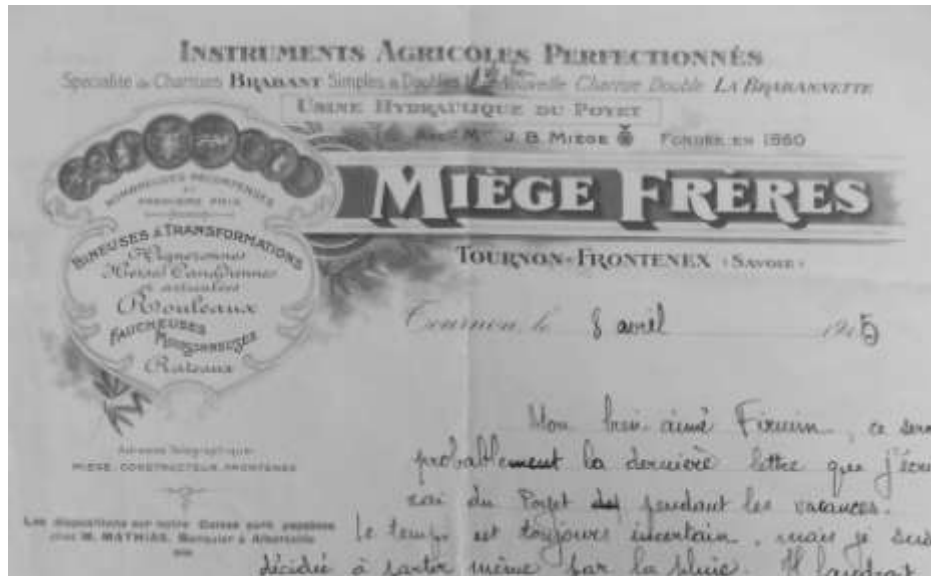
papier à en-tête de l'usine (1915)